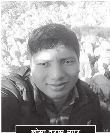
खोमा तरामु मगर

एउटा प्रसिद्ध चिनियाँ कथामा एकजना बूढो मान्छेले दुईवटा पहाडलाई कोदालोले खनेर पन्छाइरहेको दृश्य छ । त्यो देखेर एकजना 'विद्वान' ले बूढो मान्छेलाई उपहास गर्दै भन्छ, 'तिमी कस्ता मूर्ख मान्छे हो, यसरी पहाड पन्छाएर कहिल्यै सकिन्छ त ?' ती बूढा मान्छेले निर्धक्क जवाफ दिन्छन्, 'सकिन्छ । मेरो पालामा नसकिए छोराका पालामा सकिन्छ । छोराका पालामा पनि नसकिए नातीका पालामा सकिन्छ किनभने यी पहाडहरू कहिल्यै बढ्दैनन् । जति खनेर पन्छायो, उति घट्दै जान्छन् । यसरी घट्दै जाँदा एक दिन अवश्य सकिन्छ ।' ती बूढा मान्छे बाटो छेकेर उभिएको पहाड खनिरहन्छ । ती बूढा मान्छेको उच्च साहस, अटुट विश्वास, अविचल निष्ठा र अविरोध सङ्घर्षले बाटो छेकेर उभिएका ती उच्च पहाडहरू एक दिन ढल्छन् । अर्थात् ती बूढा मान्छेको पहाड पन्छाउने सपना वास्तवमै पूरा हुन्छ र उसले आफूलाई मूर्ख नभएको सिद्ध गर्छन् ।