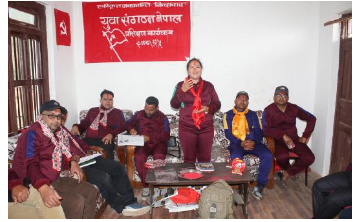
भ्रमका पछाडि नलाग्नु आग्रह गरिन्। उनले गरी वैज्ञानिक समाजवाद स्थापना गरेरै नेकपाले विद्यमान संसदीय व्यवस्था अन्त्य छोड्ने प्रतिबद्धता पनि जनाइन्।