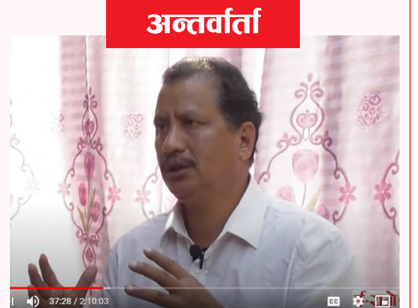
विप्लव महासचिव, नेपाल कम्युनिस्ट पार्टी