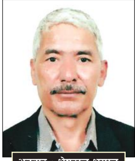
अनुवाद : भेषराज भुसाल

दोस्रो हो अदृश्य अतिरिक्त जनसङ्ख्या अर्थात् ग्रामीण क्षेत्रका अतिरिक्त जनसङ्ख्या। कृषि उत्पादनको पुँजीवादीकरण र पुँजीका अवयवी सङ्घटनमा वृद्धि भएपछि कृषि मजदुरहरूको माग घट्न जान्छ। योभन्दा पनि बढेर कृषि क्षेत्रमा श्रम शक्तिको यो विस्थापन निरपेक्ष हुने गर्दछ। जबसम्म अर्को नयाँ जमिन कृषियोग्य बनाईदैन तबसम्म अरू श्रमशक्ति खपत हुन सक्दैन। पुँजीवादी कृषिद्वारा विस्थापित मजदुरहरू केही सहरहरूमा जाने गर्दछन्। अन्य जमिनको सानो टुक्रासँग टाँसिइरहन्छन्। केहीले यताउताका काम गरेर पेट पाल्छन्। उनीहरू स्वरूपमा बेरोजगार नदेखिन सक्छन् तर कृषि उत्पादनका निमित्त तिनीहरू फाल्तु हुने गर्छन्। यसलाई अदृश्य अतिरिक्त जनसङ्ख्या