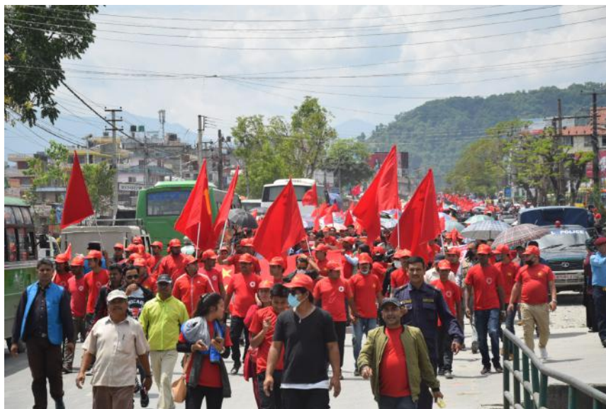
नेपाल ट्रेड युनियन महासङ्घ (रिफेन), नेकपा (संयुक्त) निकट अखिल नेपाल ट्रेड युनियन फेडेरसन र सीपी मैनालीले नेतृत्व गरेको नेकपा (माले) निकट प्रगतिशील नेपाल स्वतन्त्र ट्रेड युनियन महासङ्घ

आज मङ्गलबार वैशाख १८ गते अर्थात् मे १, अन्तर्राष्ट्रिय मजदुर दिवस नेपालमा मात्र होइन विश्वभरि मनाइँदैछ । पहिला विश्वका सर्वहारावर्गीय पार्टी र सङ्गठनहरूले मात्र अन्तर्राष्ट्रिय श्रमिक दिवसका रूपमा मनाउने गर्दथे । अहिले आएर पुँजीवादी देश र सङ्गठनहरूले पनि यसलाई उत्सवका रूपमा मनाउने गरेका छन् । त्यसैअनुरूप नेपालमा पनि सरकारी तहबाटै यस दिन सार्वजनिक बिदा दिने गरिएको छ । यही क्रममा नेपालका क्रान्तिकारी मजदुर सङ्गठनहरूले संयुक्त रूपमा काठमाडौँमा विभिन्न कार्यक्रम गरेर दिवस मनाउँदैछन् । वर्तमान केपी शर्माको सरकारले विप्लवले नेतृत्व गरेको नेपाल कम्युनिस्ट पार्टी र उसका भ्रातृ सङ्गठनहरूमाथि प्रतिबन्ध लगाएको भए पनि अखिल नेपाल क्रान्तिकारी ट्रेड युनियन महासङ्घ, नेकपा (माओवादी केन्द्र) निकट अखिल