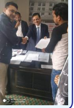
बाँकी पृष्ठ ७ मा

काठमाडौँ : विप्लव नेकपा निकट अखिल क्रान्तिकारीले विभिन्न मागहरू राख्दै शिक्षामन्त्रीलाई मंगलबार सिंहदरबारभित्रै ज्ञापनपत्र बुझाएको छ। ६ बुँदे ज्ञापनपत्रमा निजी शिक्षणसंस्थाहरूले देशव्यापी वृद्धि गरेको ४० प्रतिशतसम्म शुल्क फिर्ता लिन र शुल्कवृद्धि गर्नेहरूलाई कारवाही गर्न, सरकारी सामुदायिक विद्यालयहरूमा नेपाली र अङ्ग्रेजी माध्यमबाट अध्यापन गर्ने नाउँमा लिइएको शुल्क तत्काल फिर्ता गरी निःशुल्क अध्ययन गर्ने वातावरण