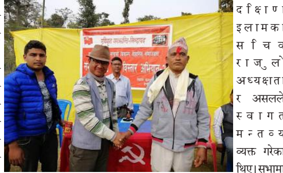
सामना परिवारका कलाकारहरूले जनवादी सांस्कृतिक कार्यक्रम प्रस्तुत गरेका थिए। कार्यक्रममा जनवर्गीय सञ्चालनका नेताहरू, पार्टी ब्युरो सदस्यहरू र बुद्धिजीवीहरूको उपस्थिति थियो। कार्यक्रम अवधिमा विभिन्न पार्टीका कार्यकर्ता नेकपामा प्रवेश गरेका थिए।