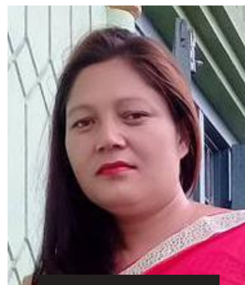
सीता विक 'सम्झना'

वसन्तऋतुको रमभ्रम अनि ढकमक्क फुलेका लालीगुराँसका फूलहरूसँगै लुकामारी खेल्दै अविचल विजयहुरीको काखबाट इतिहासका महान् निर्माता जनसमुदायको सामीप्यमा लुट्पुटिँदै महान् अक्टोबर क्रान्तिको ढोका नेपाली धर्तीबाट पुनः एकपटक खोलेर संसारभरका श्रमजीवी समुदायलाई विश्वमा क्रान्तिको सफलता निश्चित रहेको सन्देश प्रवाहित गर्ने उच्च अभिलाशा हामीमा थियो। पार्टीको रणनीतिक प्रत्याक्रमणको योजनालाई सफलताको दिशातिर डोच्याउने उद्देश्यका साथ हाम्रो मङ्गलसेन फर्स्ट ब्रिगेड पनि युद्धमैदानमा जानुभन्दा अघिका सबै प्रक्रिया पूरा गरी 'अन्तिम मार्च' को अत्यन्तै