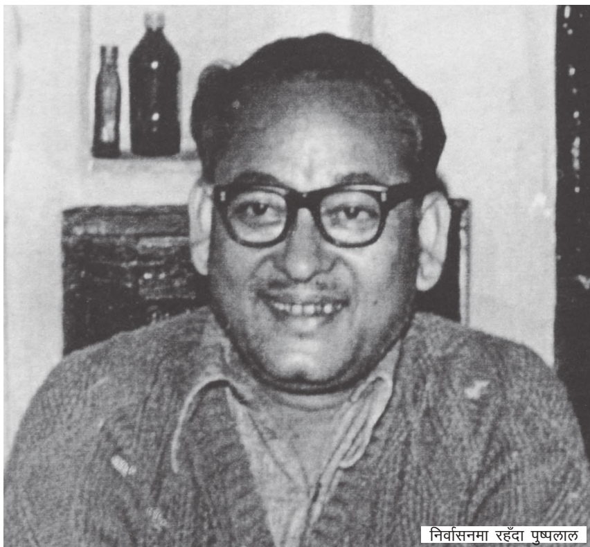
निर्वासनमा रहेका पुष्पलाल