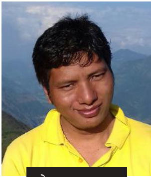
खोमा तरामु मगर

(लुम्बिनीको सेरोफेरोमा सांस्कृतिक मोर्चा)