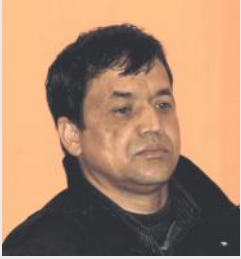
■ लालबहादुर विसी

शिक्षक र शिक्षाबीच आयोन्याश्रित सम्बन्ध हुन्छ । एउटा शिक्षकले समाज, प्रकृति र विज्ञान प्रविधिमा आएको परिवर्तनअनुसार नयाँ सोच र चिन्तन बनाउन जरूरी हुन्छ । आज हामी विज्ञान प्रविधि, ग्लोबल अवस्था र आइटीको विकासले विश्वसँग अभिन्न हुँदै छौं । आजको शिक्षकले नयाँ दर्शन दृष्टिकोणअनुसार सिकने, सोच्ने, पढ्न लेख्न र पढाउन सिकनुपर्दछ । शिक्षकले राज्यद्वारा निर्मित पाठ्यक्रम पाठ्यपुस्तक पढाएर मात्र हुँदैन । समाज, विद्यार्थी र विश्वमा आएको फेरबदलसँगै प्रकृतिविज्ञान र समाजविज्ञानलाई अध्ययन गरेर शिक्षाको नयाँ दर्शन दिन सक्नुपर्दछ । हाम्रो पुरानो धर्म संस्कृति, दर्शन र परम्पराले निर्माण गरेको चेतनाले समाज र राष्ट्रको कल्याण गरेन । यी सबैलाई अध्ययन गर्दा नयाँ सत्यको खोजी भएको छ । त्यसैले शिक्षकहरूले व्यवहारमा सिद्धान्तमा, सोचमा र कर्तव्यमा नयाँ शिक्षाको दर्शनको खोजी गर्नु पर्दछ । उत्पीडित, सिमान्तकृत जाति, वर्ग, भूगोल र विषय परिस्थितिलाई हेरेर शिक्षाको पाठ्यक्रम पाठ्यपुस्तक बनाउनुपर्दछ । हाम्रो सोच, प्रवृत्ति, भाषा, संस्कृति र राजनीतिक प्रणालीका पुराना सोच भत्काउनुपर्दछ । सीमाहरू बदलिन्छन्, नयाँ दृष्टिकोण दिन जरूरी छ । पुरानोलाई पुनःपरिभाषित गर्नुपर्दछ । साहित्यकला संस्कृति, राजनीतिक सिद्धान्तका क्षेत्रमा नयाँ स्तरबाट सोच्नुपर्दछ । पुरानोबाट चित्त बुझाउने र ढुक्क हुने ठाउँ छैन । पाठ्यक्रम, शिक्षालयको शिक्षा पद्धति, शिक्षाको उद्देश्य, विधि, शिक्षक विद्यार्थीको अवस्थाको विषयमा पुरानो शिक्षाको पद्धतिले राम्रो गर्न सक्दैन । नयाँ खोजको जरूरी छ भन्ने कुरा शिक्षकले बुझ्नुपर्दछ ।