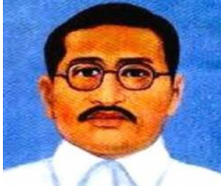
अमर सहिद शक्रराज शहादत : वि.सं. १९९७ माघ १०