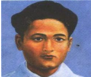
अमर सहिद गंगालाल शहादत : वि.सं. १९९७ माघ १५