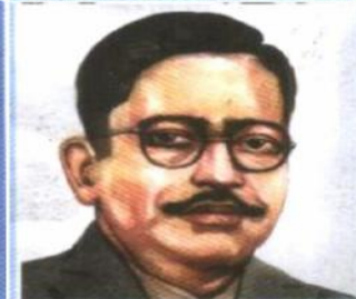
अमर सहिद दशरथ चन्द शहादत : वि.सं. १९९७ माघ १५