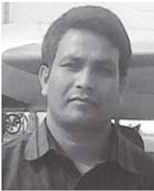
शक्ति विक 'हिमसिखर'