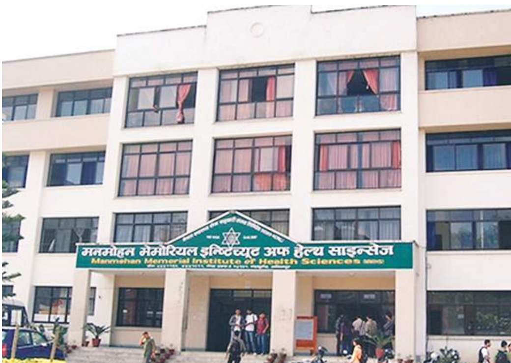
विवादको केन्द्रमा रहेको एमाले नेताहरुद्वारा सञ्चालित मनमोहन मेमोरियल इन्स्टिट्यूट अफ हेल्थ साइन्सेज ।

प्रस्तावित विधेयकअनुसार अब त्रिवि र केयूले थप मेडिकल कलेजलाई सम्बन्धन दिन पाउने छैनन् । नयाँ विधेयकमा सम्बन्धनपूर्व ३ वर्ष अस्पताल पूर्ण रूपमा सञ्चालन भएको र स्वास्थ्य मन्त्रालयको सिफारिस लिनुपर्ने भएको छ ।