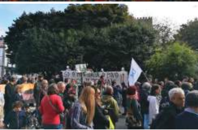
अक्टोबर क्रान्तिपछि लेनिनले सम्बोधन गर्दै गरेको सन्दर्भ चित्रमा (माथि) र इटालीया अक्टोबर क्रान्तिको शतवार्षिकी मनाउँदै इटालियन कम्युनिस्ट पार्टीका कार्यकर्ता।