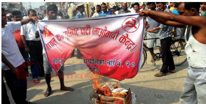
माओवादी केन्द्रका कार्यकर्ताद्वारा विरगञ्जमा आफ्नै पार्टीको ब्यानर जलाउँदै।