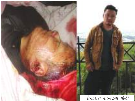
सेनाद्वारा कञ्चटमा गोली

ए क ज न । प्रदर्शनकारीको बेवारिसे लास भेटिएपछि शनिवार दार्जिलिङमा भएको आक्रोशित भीडमाथि अर्धसैन्य बलले अन्धाधुन्ध गोली बर्षाउँदा थप तीन जना भारतीय नागरिकको मृत्यु भएको छ । नेपाली भाषीहरूले भारतीय गृहमन्त्री निवासमा ज्ञापनपत्र दिन अगाडि बढेका प्रदर्शनकारीलाई दिल्ली प्रहरीले