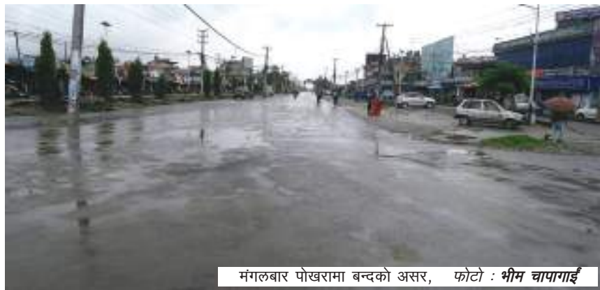
मंगलबार पोखरामा बन्दको असर