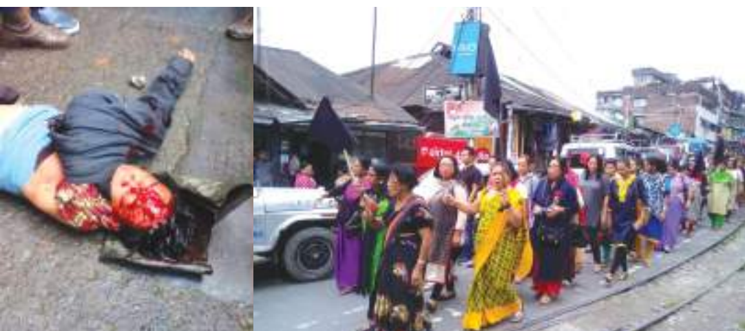
दार्जलिङ गोली काण्डका मृतक (बायाँ) र महिलाहरूको विरोध प्रदर्शन (दायाँ), दार्जलिङ