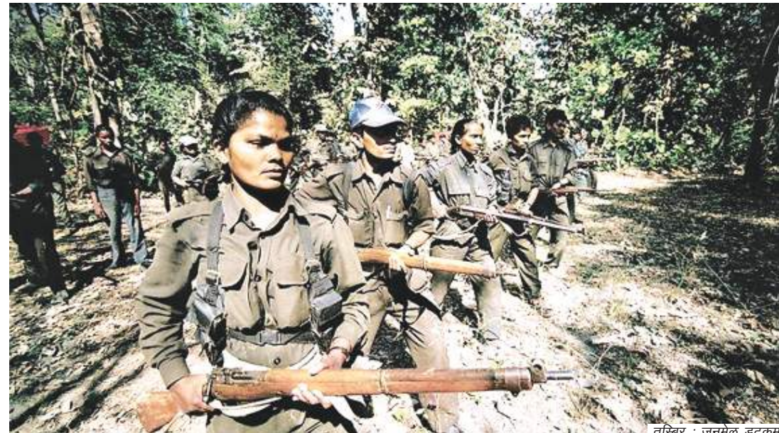
तरिबर : जनमेल डटकम